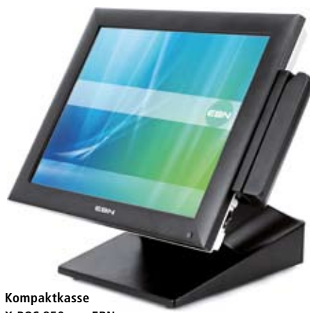
Kompaktkasse X-POS 850 von EBN

EBN Technology Corp/PC-PoS | Die Kompaktkasse X-POS 850 von EBN ist ein All-in-one-Gerät mit integriertem 15-Zoll-Monitor, das sich speziell auch für die Anforderungen in der Gastronomie und im Gesundheitsmanagement eignet. Als erstes Kassensystem verwendet die X-POS 850 einen leistungsstarken Intel-Atom-Doppelkernprozessor. Der 1,66 GHz Intel Atom Dualcore D510 ermöglicht, zusätzlich zur schnelleren Abwicklung von Transaktionen, die parallele Nutzung von anspruchsvollen und rechenintensiven Anwendungen wie etwa CRM-Systemen oder Multimedia-Marketing. Datenbankanwendungen können lokal anstatt auf externen Servern installiert werden. Die Leistungssteigerung durch das Kompaktkassensystem