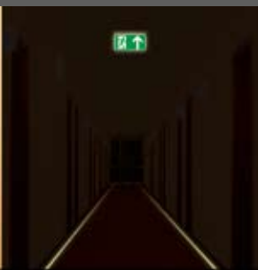
Im Notfall lebenswichtig.

Flucht- und Rettungssysteme von P.E.R. sorgen für einen sicheren Hotelaufenthalt.